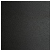
GFM69 graphit gaufriert