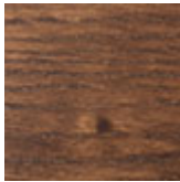
frNC Esche gebeizt Nussbaum Canaletto