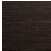
frRB Esche gebeizt "verbrannte Eiche"